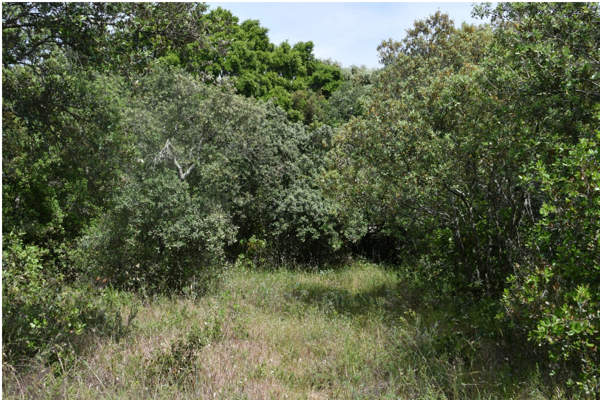
Figure 2. Clairière d'un petit bois à Quercus ilex . Saint-Jean-de-Fos (34), le 6 mai 2020 ; © Guillaume Fried.

Par ailleurs, différents passages sur cette pelouse-friche entre avril 2015 et mai 2020 ont permis de noter : Aira caryophyllea , Andryala integrifolia , Anisantha madritensis , A. tectorum , Bothriochloa barbinodis , Bunias erucago , Campanula erinus , Carduus pycnocephalus , Celtis australis , Centaurea aspera subsp. aspera , C. benedicta , Cerastium glomeratum , C. pumilum , Chondrilla juncea , Clinopodium nepeta subsp. nepeta , Crepis vesicaria subsp. taraxacifolia , Cynodon dactylon , Daucus carota subsp. carota , Erodium cicutarium subsp. cutarium , Euphorbia segetalis subsp. segetalis , E. serrata , Geranium molle , G. rotundifolium , Hedypnois rhagadioloides , Helichrysum stoechas , Hypericum perforatum , Hypochaeris glabra , Jasione montana , Lathyrus angulatus , L. cicera , Lysimachia linum-stellatum , Lupinus angustifolius , Microthlaspi perfoliatum , Ornithopus compressus , Orobanche minor , Papaver rhoeas , Polycarpon tetraphyllum , Poterium sanguisorba , P. verrucosum , Reichardia picroides , Tordylium maximum , Tragopogon porrifolius , Trifolium arvense , T. campestre , T. hirtum , Trigonella wojciechowskii , Urospermum dalechampii , U. picroides , Veronica arvensis , Vicia hybrida et Viola kitaibeliana .