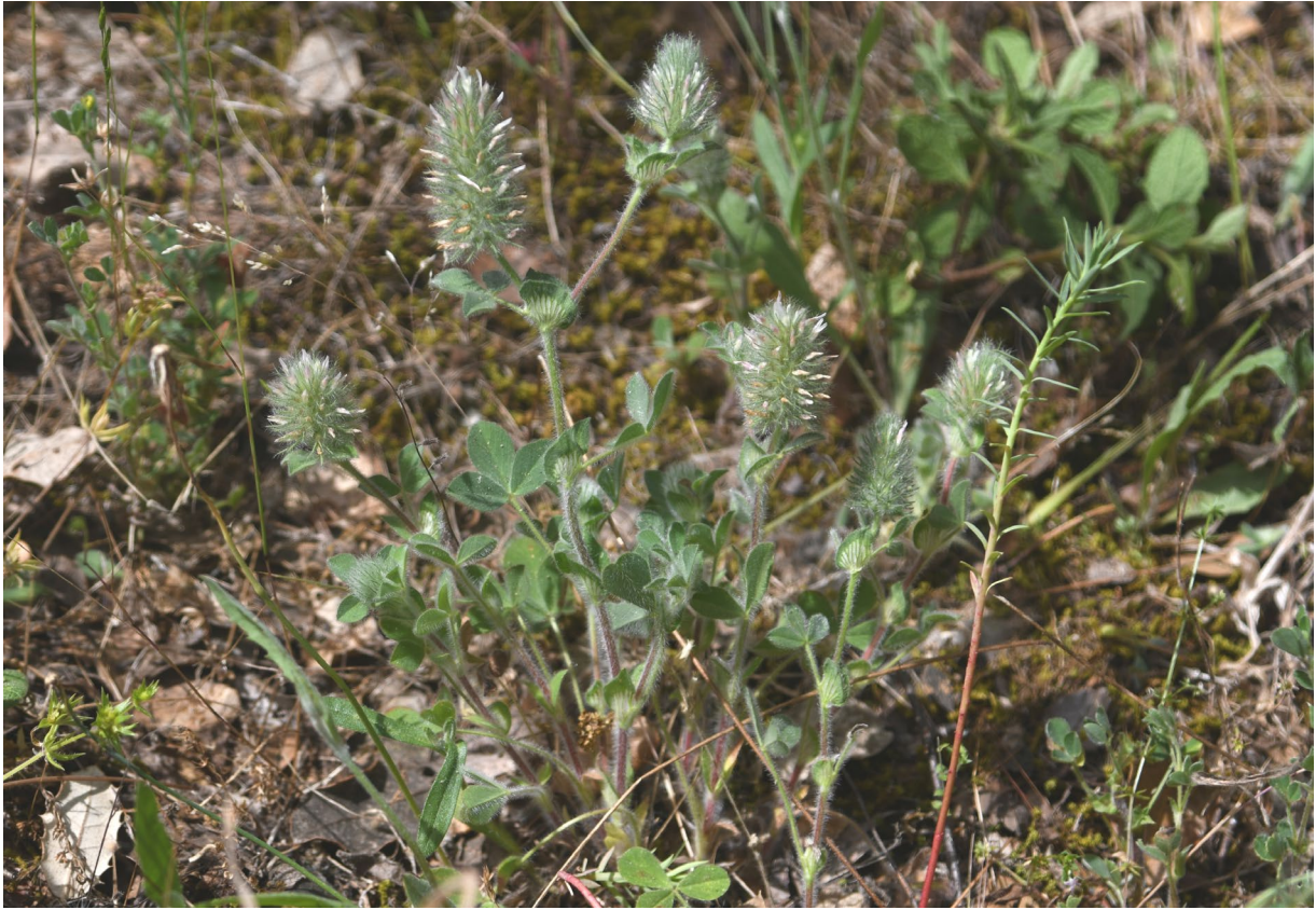
Figure 6. T. sylvaticum . Aspect général. Saint-Jean-de-Fos (34), le 6 mai 2020 ; © Guillaume Fried.

Sophie Lafitte, pour la réalisation de la carte de la figure 3.