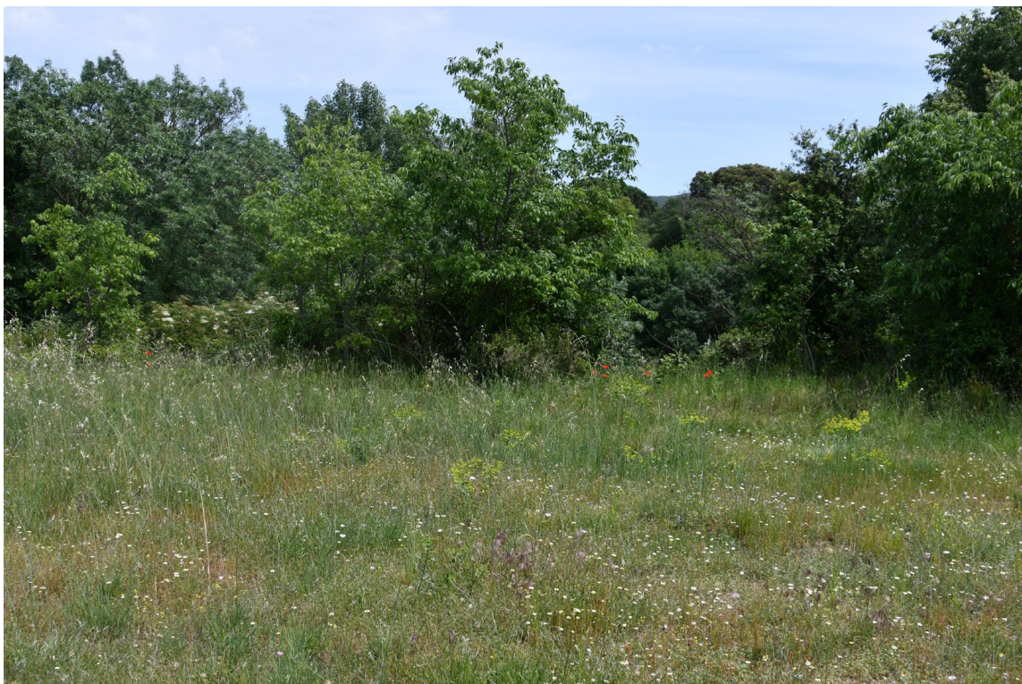
Figure 1. Pelouse-friche sur sol décalcifié abritant une station de Trifolium sylvaticum . Au fond, ripisylve et bois de chêne vert. Saint-Jean-de-Fos (34), le 6 mai 2020 ; © Guillaume Fried.

Les deux stations, très proches l'une de l'autre, se trouvent au sud du village de Saint-Jean-de-Fos sur des alluvions de la moyenne terrasse de l'Hérault, 20 m au-dessus du lit du fleuve. Les sols établis sur ces terrasses correspondent à des sables et graviers, avec une forte décalcification des horizons superficiels (Alabouvette, 1982). Le paysage est