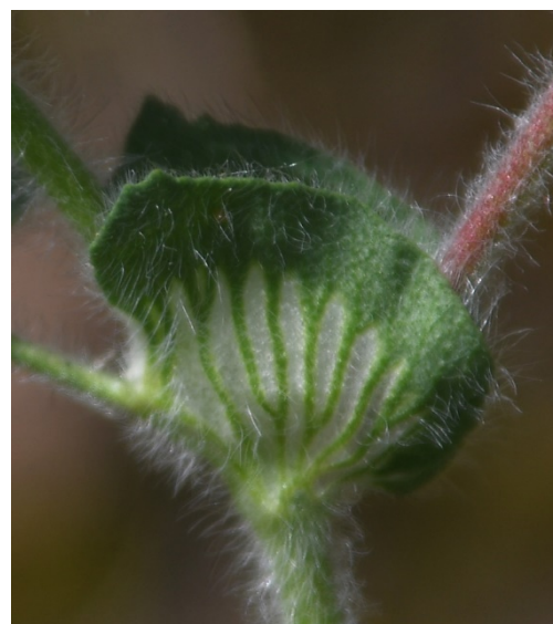
Figure 5. T. sylvaticum . Stipules largement ovales à suborbiculaires. Saint-Jean-de-Fos (34), le 6 mai 2020