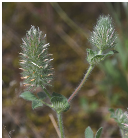
Figure 4. T. sylvaticum . Aspect typique de la double inflorescence. Saint-Jean-de-Fos (34), le 6 mai 2020 ; © Guillaume Fried.

En conclusion, cette découverte inédite, dans un secteur pourtant largement prospecté depuis très longtemps, montre que la recherche de lentilles décalcifiées, à l'aide des cartes géologiques, réserve parfois de remarquables découvertes.